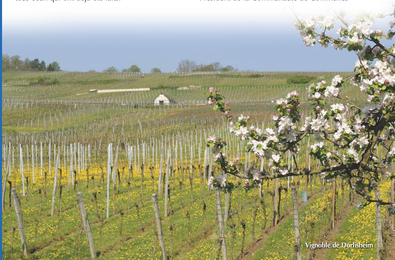
Vignoble de Dorlsheim