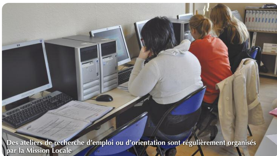
Des ateliers de recherche d'emploi ou d'orientation sont régulièrement organisés par la Mission Locale

Créée en 1982 et membre du Service Public de l'Emploi depuis cette date, la Mission Locale de Molsheim fête, cette année, ses 30 ans d'existence. Cœuvrant sur le territoire Bruche Mossig Piémont, cette structure accueille les jeunes de 16 à 25 ans, sortis du système scolaire, pour les accompagner dans leurs parcours d'insertion sociale et professionnelle.