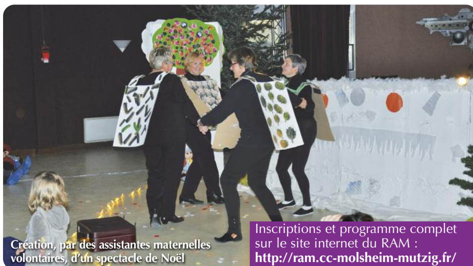
Création, par des assistantes maternelles volontaires, d'un spectacle de Noël

"Etre professionnelle, c'est s'identifier à une profession, en acceptant les règles, revoir ses pratiques et accepter d'en changer."