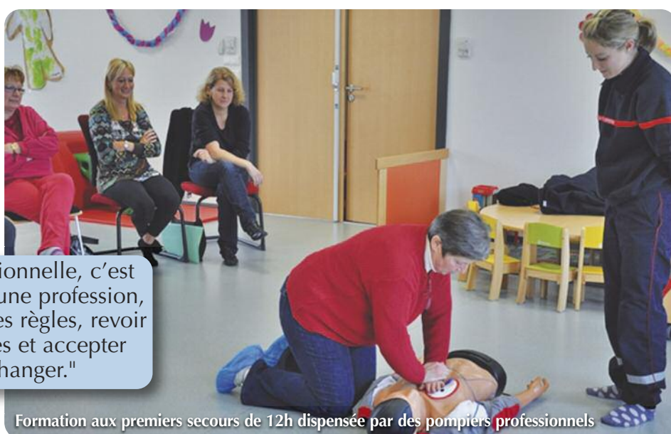
Formation aux premiers secours de 12h dispensée par des pompiers professionnels

"Etre professionnelle, c'est s'identifier à une profession, en acceptant les règles, revoir ses pratiques et accepter d'en changer."