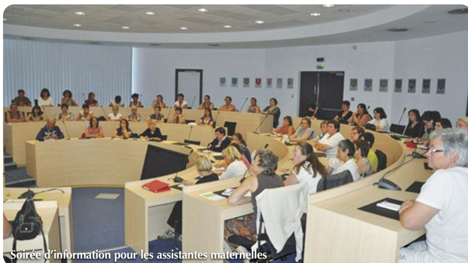
Soirée d'information pour les assistantes maternelles

A noter que le RAM n'exerce aucun contrôle sur l'activité des professionnelles en charge de l'enfant. Sa fréquentation est basée sur le volontariat. Les activités proposées par le RAM favorisent les échanges, le partage d'expérience, interrogent les pratiques professionnelles, sensibilisent au besoin de formation et participent à la construction de l'identité professionnelle.