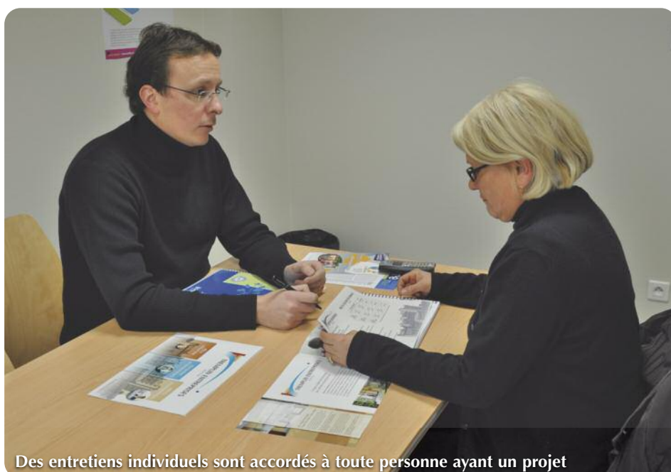
Des entretiens individuels sont accordés à toute personne ayant un projet

16 entreprises sont, actuellement, hébergées à Tremplin Entreprises, elles représentent environ 40 emplois dans des secteurs d'activités non délocalisables . Depuis 2009, une entreprise a pu sortir de la pépinière pour se développer. Les prochaines "sorties" sont programmées pour cet été. L'objectif à terme étant d'atteindre 5 à 6 entrées et sorties chaque année.