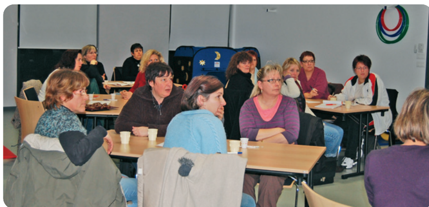
Réunion organisée par le Relais le 1 er décembre 2009.

Son objectif : réunir les assistantes maternelles pour réfléchir sur l'élaboration d'une Charte d'Accueil destinée à définir le déroulement des animations collectives.